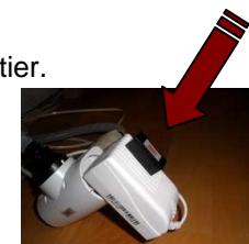
Music pro sur Box boîtier d'alimentation

Si la box est alimentée par un petit boîtier sur la prise de courant, placez le Music Pro numérique extérieur sur ce petit boîtier.